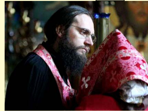
Фото и видео на мероприятии

Сегодня жениху и невесте разрешают пройти подготовительные обряды — Исповедь и Причастие — накануне официального торжества. Исповеди